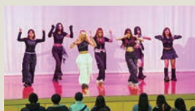
“明るく温かな”空気をつくる、学生たちのパフォーマンス