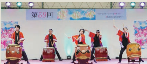
J和太鼓部の皆さんが、力強い演奏でオープニングを飾りました

学園祭終了後には、学生たちの間から、「来年も、多くの方に楽しんでいただけるよう、実行委員・学生一同、力を合わせていきたい」という声が多く上がりました。