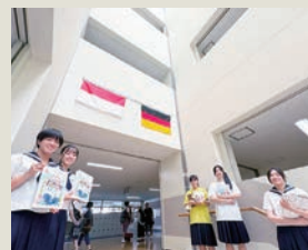
来場者を笑顔でお迎えます

そして、開催日当日も、学年・クラス・部活など、それぞれの場所で、最高の十文字祭を創るために、一人ひとりが力を出し合いました。思い出深い2日間となりました。