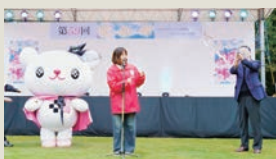
学長とプラスちゃんが登場し、桐華祭が華やかに開幕