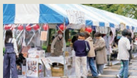
模擬店エリアには多くの来場者が立ち寄り、賑わっていました