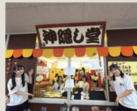
懐かしい時代を再現した駄菓子屋さん