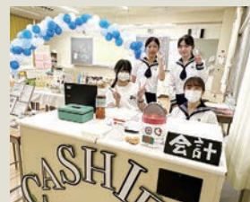
JRC部によるフェアトレード商品の販売。売上金は赤十字に寄付します