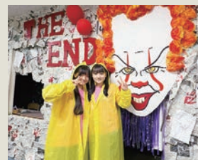
お化け屋敷の雰囲気づくりも完璧！