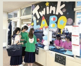
キラキラの世界を表現した近未来カフェ☆