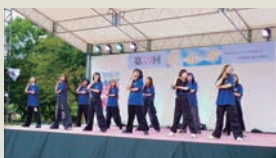
雨にも負けず、会場内は熱気に包まれた