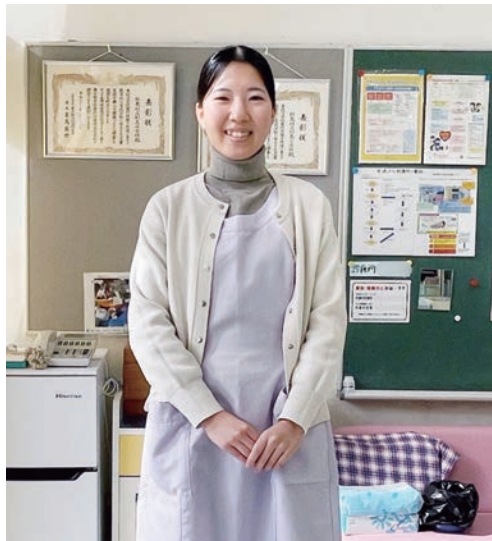
利島村立利島小中学校の保健室で (プロフィール) 埼玉県立川越総合高等学校卒業後、十文字学園女子大学教育人文学部心理学科で学び、現在、東京都教育委員会の養護教諭として勤務している。