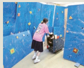
“マツ”ライトイヤーで光の彼方へいざ発進！（体験型アトラクション）