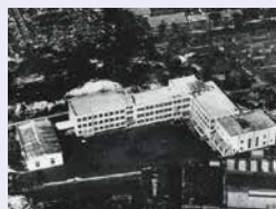
戦災前の学校全景(1936年)