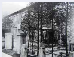
創立当時の校舎(1922年頃)